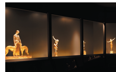
似鳥美術館1F 新展示室 展示風景

小樽芸術村の「似鳥美術館」では、2018年4月1日よりアール・ヌーヴォー、アール・デコの彫刻作品を展示する新しい展示室を増設いたしました。また、日本を代表する作家作品を新たに収蔵し、展示公開いたしました。