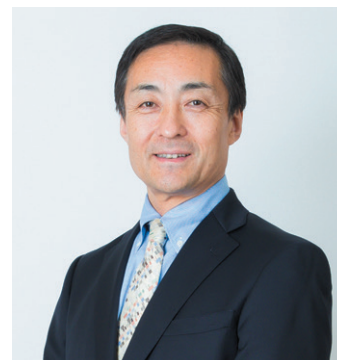
代表取締役社長 兼最高執行責任者（COO）

当社グループは、お陰様で2017年12月に創業50周年の節目を迎えました。これからも進化し成長し続ける企業であるために、創業以来大切にしてきた「現状否定」の文化のもと改革への挑戦を続けてまいります。株主の皆様には、一層のご支援ご鞭撻を賜りますようお願い申し上げます。