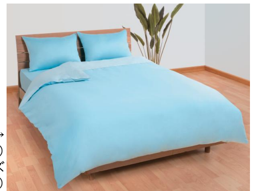
→ ひもなしらくらく掛ふとんカバー (Nグリップ) ブルー ダブルサイズ 3,800円(税別)