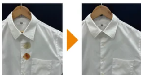
醤油、ケチャップ汚れ 綿100%シャツ