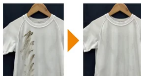
泥汚れ ポリエステル100%シャツ