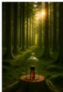
※大地や森林の香り

さらに、ニトリの吸湿発熱素材「Nウォーム」を用いたアイマスクに装填することで、香りとうもろりが調和し、心地よい睡眠環境を提供する製品として構想されています。