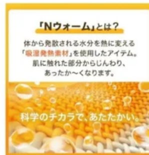
※地上使用における素材の特性