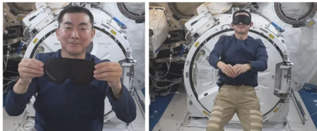
アイマスクを使用する様子