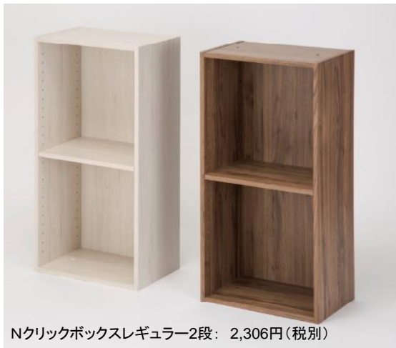
Nクリックボックスレギュラー2段：2,306円(税別)

「Nクリックボックス」 Nクリック™シリーズより「Nクリックボックス」が 2018年度グッドデザイン賞を受賞いたしました。