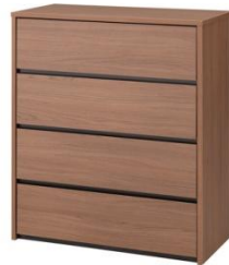
Nクリックチェスト：11,019円（税別）

簡単組み立ての動画は右QRコードよりご覧いただけます。 https://www.nitori.co.jp/movie/mp4/n-click_BGM_final.mp4