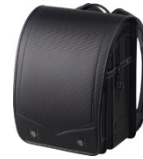
カーボンブラック