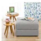
スツール(ノボケット DR-MG)