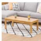
センターテーブル(レットS110 LBR)