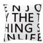
アクセントクッション(レタード)