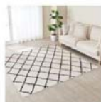
やわらかシャギーラグ(IVタイフ 165X185)