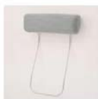
A15用 別売ヘッドレスト (DR-MG)