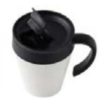
ステンレスマグSサイズ(ホワイト)