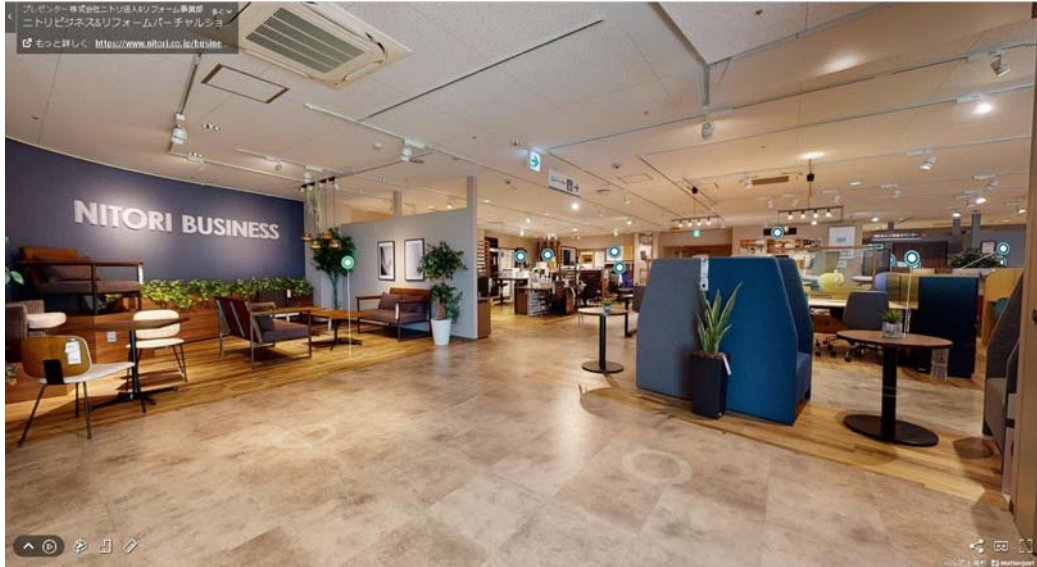
ニトリビジネス&リフォーム 渋谷（ニトリ渋谷公園通り店9階）

https://www.nitori-net.jp/ec/feature/virtualshowroom/#business