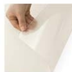
半透明デスクマット(M906-11)