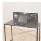
デスク/チェア(ゾッキー 80-B)