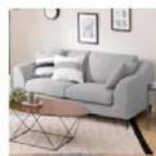
布張り2人用ワイドソファ(ノボケットA15 DR-MG)