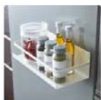
マグネットスパイスラック FLAT (ホワイト)