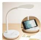
LEDデスクライト PORTE(ホワイト)