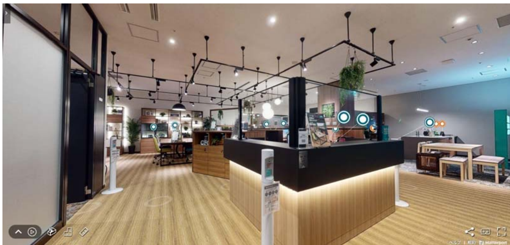
ニトリビジネス&リフォーム グランフロント大阪