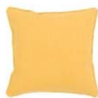
クッションカバー(ラミ2 YB)