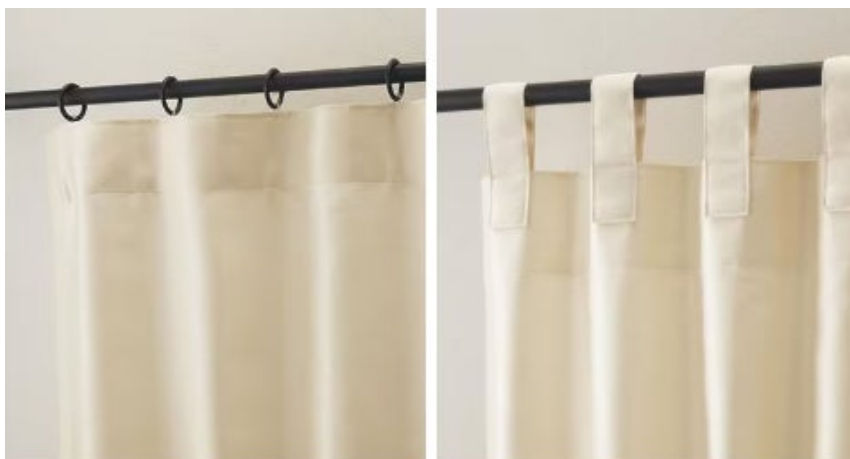
(左図) フラットスタイル (右図) タブスタイル

ニトリのオーダーカーテンは、1cm単位でオーダーしていただけるため、窓の形にぴったりの美しいカーテンが仕上がります。さらに、通常のカーテンのみならず、フラットやタブといった様々なスタイルからクッションカバーまで豊富にオーダーが可能。生地、縫製、構造など、カーテンをより美しく見せるために、様々な工夫をしています。約500種類の中から好みの生地をお選びいただくことができ、今回新たに「ECOシリーズ」が加わりました。