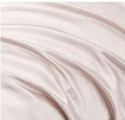
表生地のため糸にシルクを使用

（※）洗濯ネットに入れ、手洗いコースで洗濯してください。必ず中性洗剤をご使用ください。