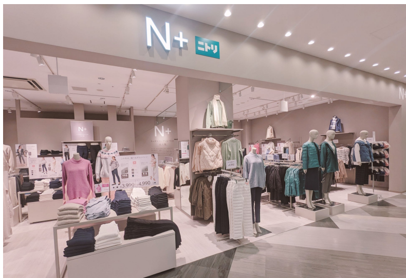
※画像はイメージです。（11月2日（木）オープン N+ MARK IS 福岡もち店）

ニトリグループでは、衣類の分野においても、お客様の立場に立って、より多くのお客様に豊かな暮らしをご提供することを目指し、今後もアパレルブランド「N+」を積極的に展開してまいります。