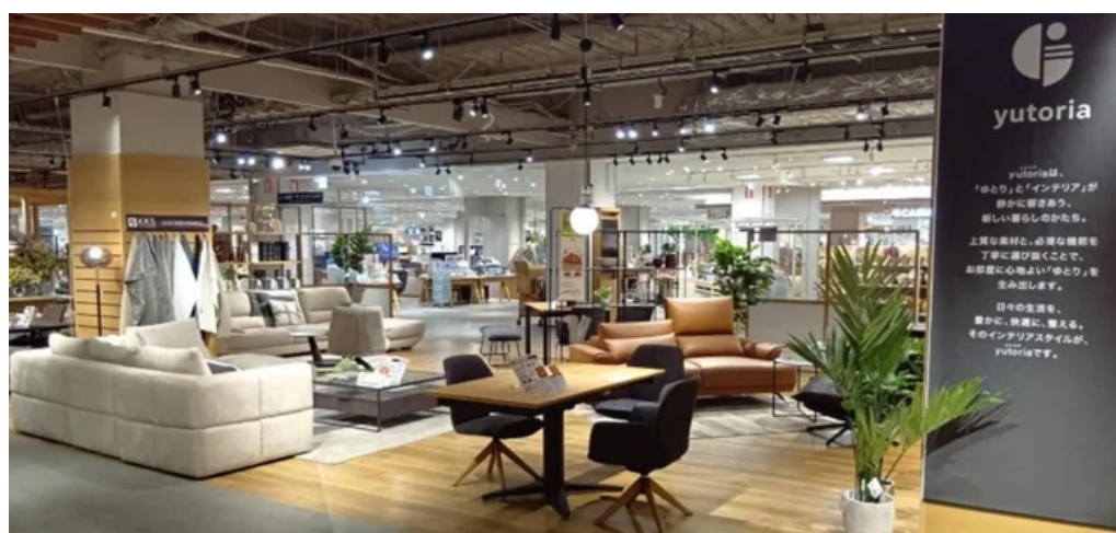
ホームズ新山下店 「yutoria（ユトリア）」 売場

「yutoria（ユトリア）」は、「ナチュラル・スタイル」「ナチュラルモダン・スタイル」「モダン・スタイル」の3つのスタイルで構成された、島忠の新しい家具ブランドです。