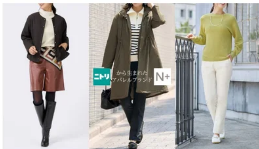
左から 吸湿発熱あったか中綿スナップボタンプルゾン（ブラック）/吸湿発熱あったか中綿スナップボタンコート（モスグリーン）/吸湿発熱あったか中綿スマートパンツ（オフホワイト）

ニトリグループのアパレルブランド「N+」を展開する株式会社Nプラス（本社：東京都北区 代表取締役社長：高橋陵）は、2025年10月20日（月）より「あったか中綿シリーズ」をニトリネットおよび全国のN+店舗にて販売開始いたしました。【特集ページ】 https://www.nitori-net.jp/ec/brands/nplus/feature/warmcollection/