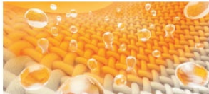
Nウォーム生地のあたたかさ比較