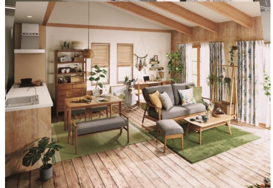
※シンガポール1号店 店内イメージ