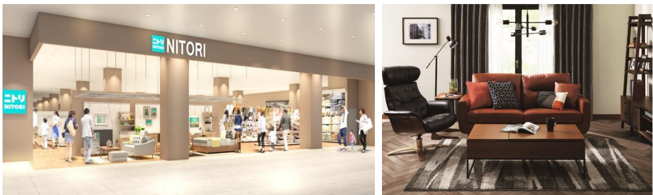
※マレーシア2号店 店内イメージ