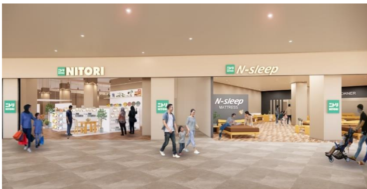
※マレーシア1号店 店内イメージ

グローバル販売事業を加速するニトリの東南アジアマーケットへの本格進出の手始めとしての店舗オープンです。今後5年間に、マレーシアで20店舗、シンガポールで10店舗の出店を予定しています。