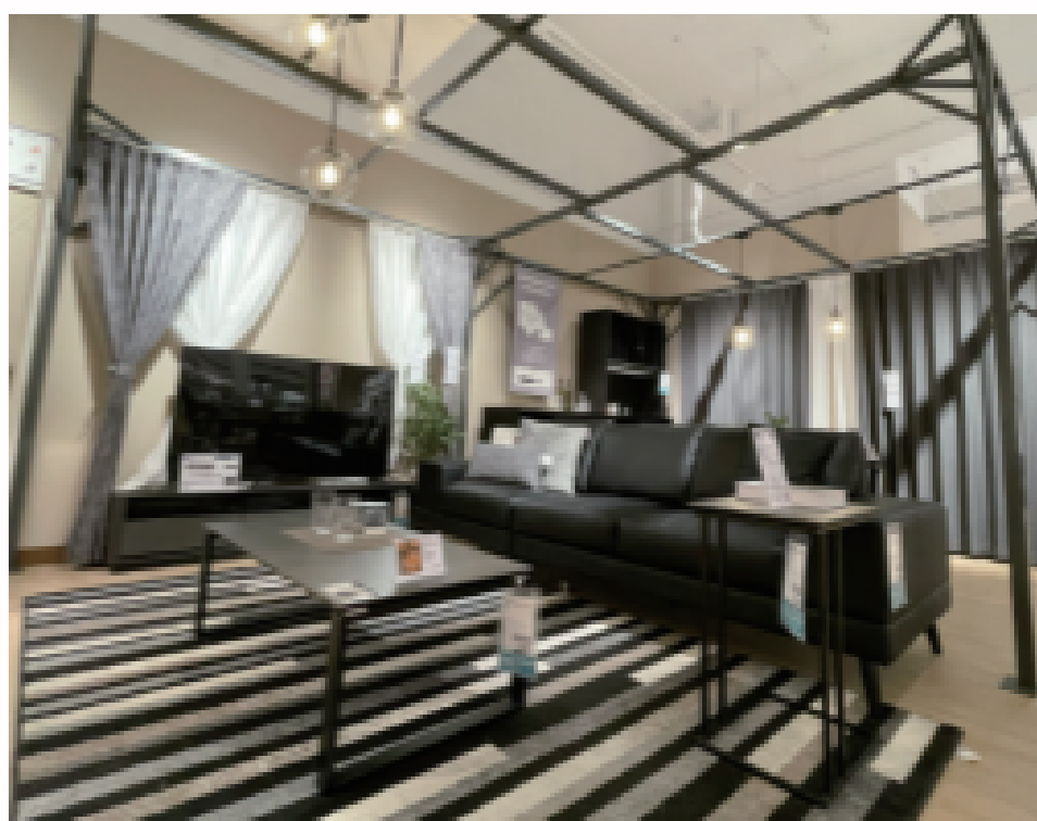
▲香港3号店のルーム

香港でこれまで展開できなかった照明用品などを含め、香港で販売可能なすべての商品が並びました。香港では馴染みのない商品の使い方や便利さを体験いただける展示を出した売場や、ルームも4カ所に展開し、コーディネート提案ができるようになりました。