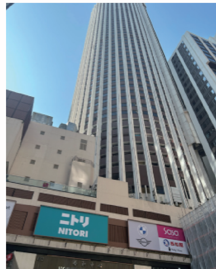
▲香港湾仔合和商場店