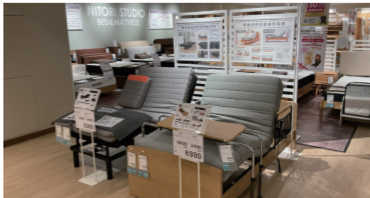
▲香港の電圧・コンセントタイプに合わせて開発された電動ベッド

香港では高齢化が進み、高額な介護費用が社会問題に。こうした背景から、平均30万円前後である電動ベッドを、ニトリは半分の価格で提供し、介護の負担軽減を目指しています。さらに、香港の暮らしに対応すべく横幅90cmのSSサイズマットレスを増やすなど、品揃えを追求しています。