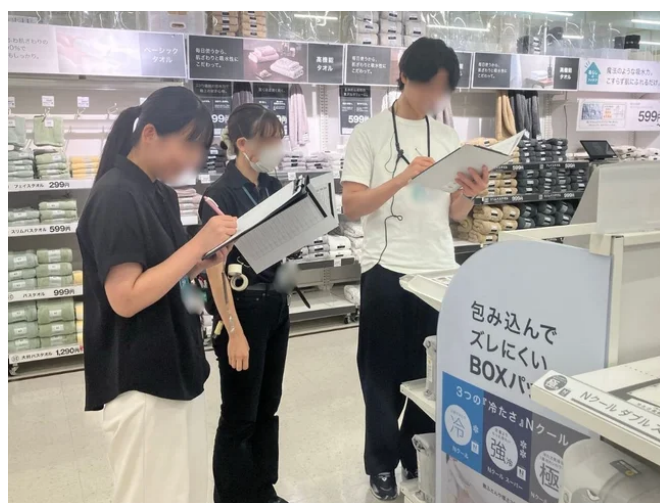
インターンシップのようす

社員のキャリア形成支援に力を入れている点や、多様な職種がある点を魅力に感じていただけたことが今回の結果につながったのではないかと考えております。