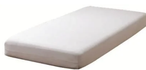
BOXシーツ（ベッド用シーツ）