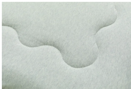
キルト加工など中わた入りの商品