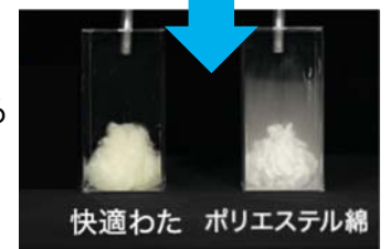
快適わた ポリエステル綿