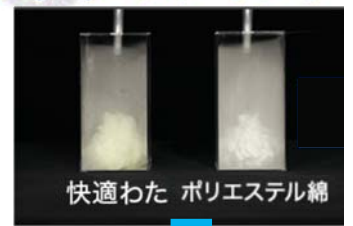
快適わた ポリエステル綿