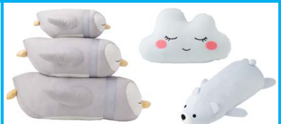
抱き枕はより柔らかいさわり心地にリニューアル