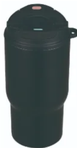
2WAYステンレスタンブラー

ストロー内蔵で飲みやすく、本体・せん・パッキンを取り外して丸洗い可能です。食器洗浄機にも対応しています。