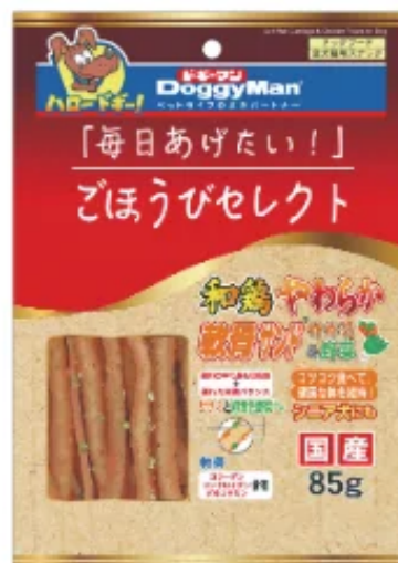
ごほうびセレクト