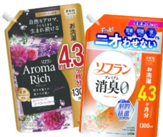
ソフランアロマリッチ/ソフランプレミアム消臭