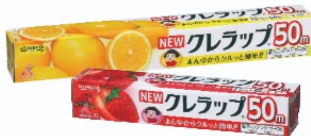
NEWクレラップお徳用ミニ /NEWクレラップお徳用レギュラー