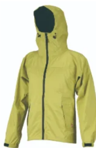
ストレッチレインジャケット

雨天時はもちろん普段使いにも対応し、アウトドアや作業時にも活躍するレインジャケットです。