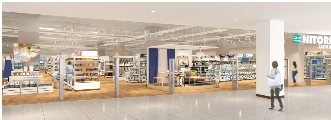
※インドネシア1号店イメージ図

株式会社ニトリホールディングス（札幌市北区、代表取締役会長兼CEO 似鳥昭雄）は、アジア地域への出店を加速すべく、インドネシア第1号店を、2024年7月にジャカルタ最大級のショッピングモール「Central Park Mall」内にオープンいたします。