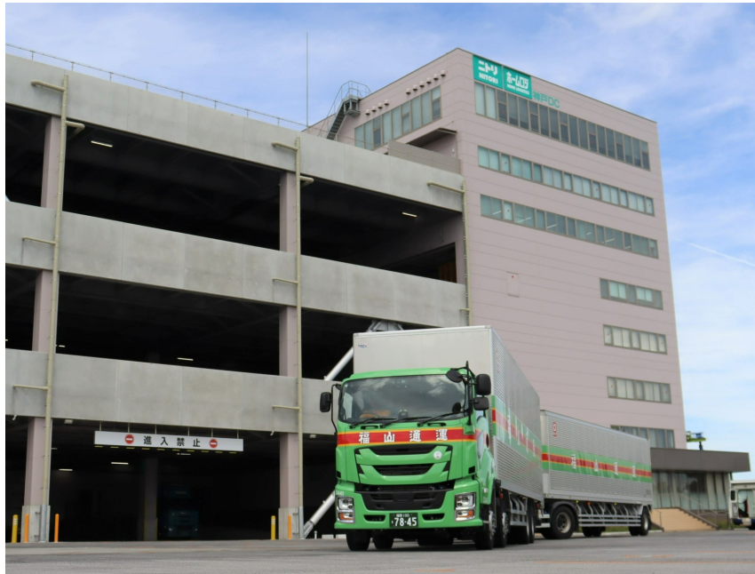
本画像はイメージです

取り組みとしては、ホームロジスティクスが運営する物流センター間の輸送に、福山通運のダブル連結トラックを導入。ダブル連結トラックを活用することで、大型トラック2台分をドライバー1人で搬送することが可能となり、商品配送におけるドライバーの労働力不足を解消します。また、CO 2 排出量の削減による地球温暖化や大気汚染などの環境負荷軽減に貢献します。8月28日より、まずは関西から九州への長距離輸送において運行を開始しました。